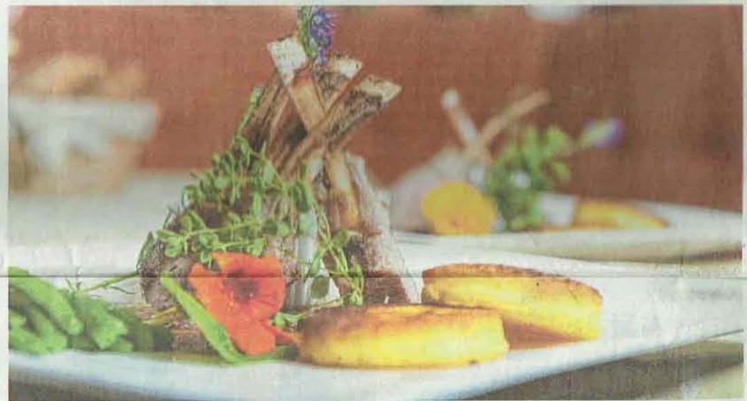
Traditionelles Wirtshaus: regionale Gerichte, schonend und schmackhaft zubereitet.

Familie Astner ist Gastgeber mit Leib und Seele und verwurzelt in den Traditionen des Tiroler Unterlandes.