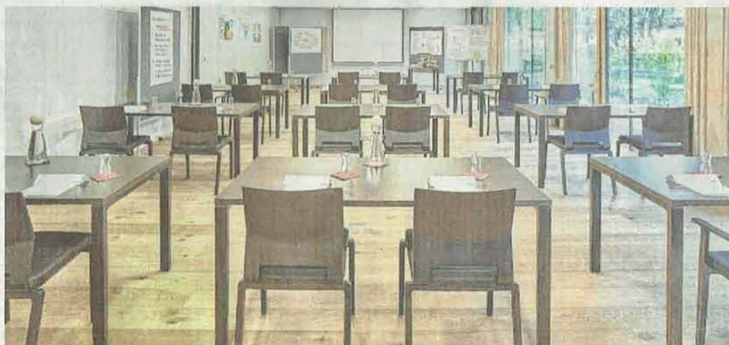
Insgesamt stehen 200 Quadratmeter an Seminarräumlichkeiten zur Verfügung – 3 schöne, lichtdurchflutete Räume.