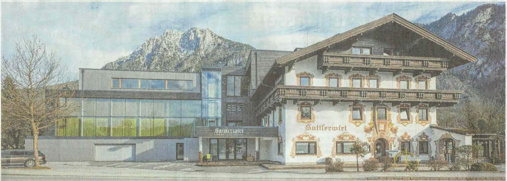
Modern und traditionell: Das ursprüngliche Wirtshaus wurde mit einem neuen Hotelbau verbunden. Gäste können so zwischen traditioneller Gemütlichkeit und moderner Architektur wählen.