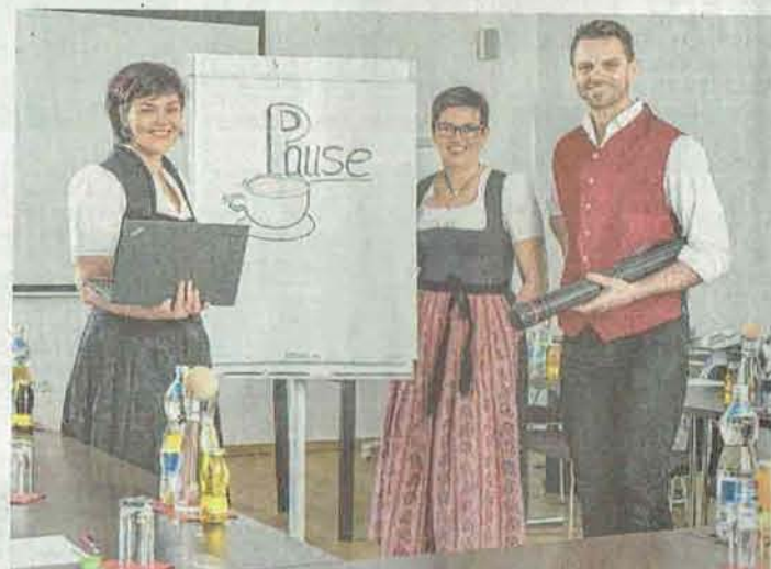
Mach mal Pause: Das Team des Sattlerwirts sorgt dafür, dass in den Pausen Erfrischungen und Stärkungen zur Verfügung stehen.