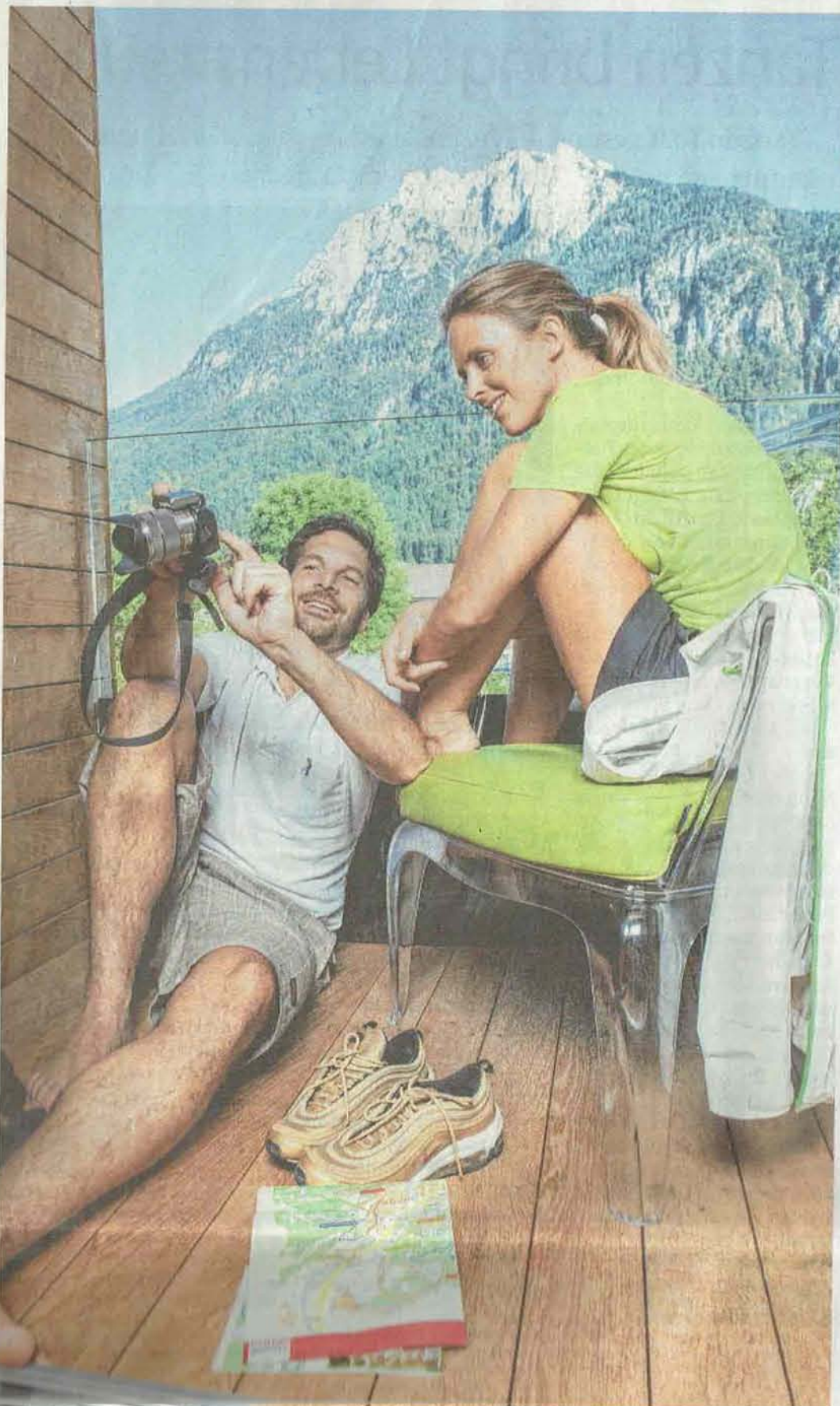
Wer viel arbeitet, darf zwischendurch entspannen: Seminargäste erwarten tolle Möglichkeiten, die Umgebung zu erkunden und den Geist frei zu machen.