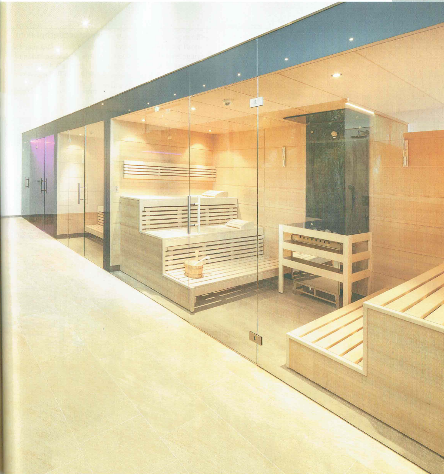
Der neue stylische Wellnessbereich umfasst auf 300 m 2 eine Finnische Sauna, ein Aromadampfbad mit Solevernebelung, eine Biosauna und eine Infrarotkabine.