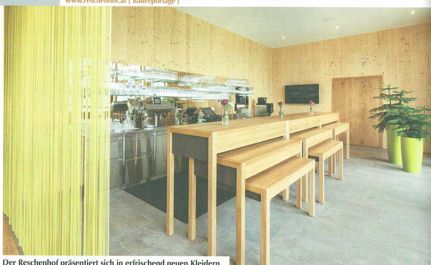
Der Reschenhof präsentiert sich in erfrischend neuen Kleidern.