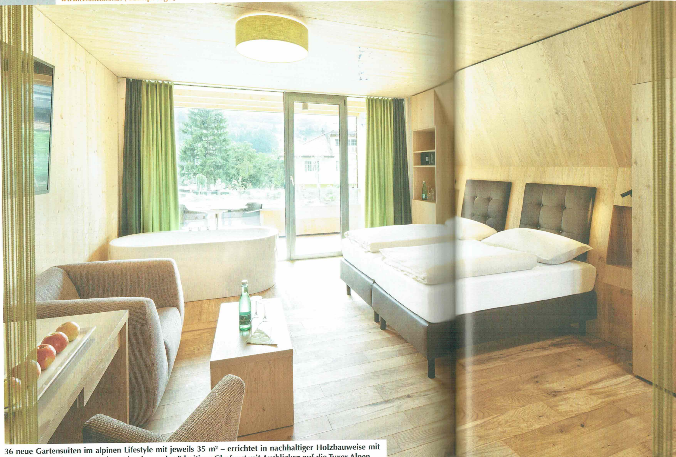
36 neue Gartensuiten im alpinen Lifestyle mit jeweils 35 m 2 – errichtet in nachhaltiger Holzbauweise mit Loggia und Physio-Intense-Infrarotdusche sowie südseitiger Glasfront mit Ausblicken auf die Tuxer Alpen.