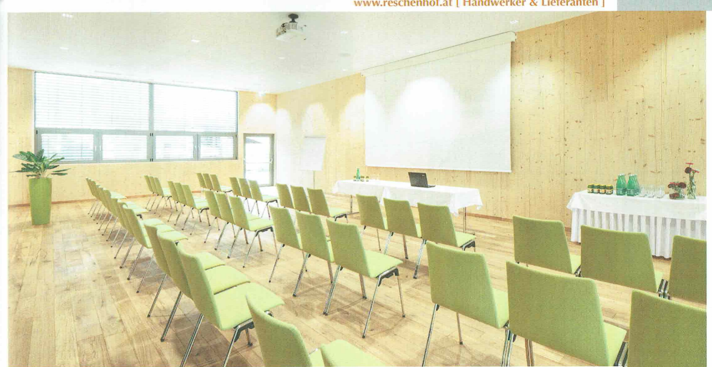
Zwei neue, kombinierbare Veranstaltungssäle mit einer Fläche von 115 m 2 bis 230 m 2 und Top-Ausstattung.