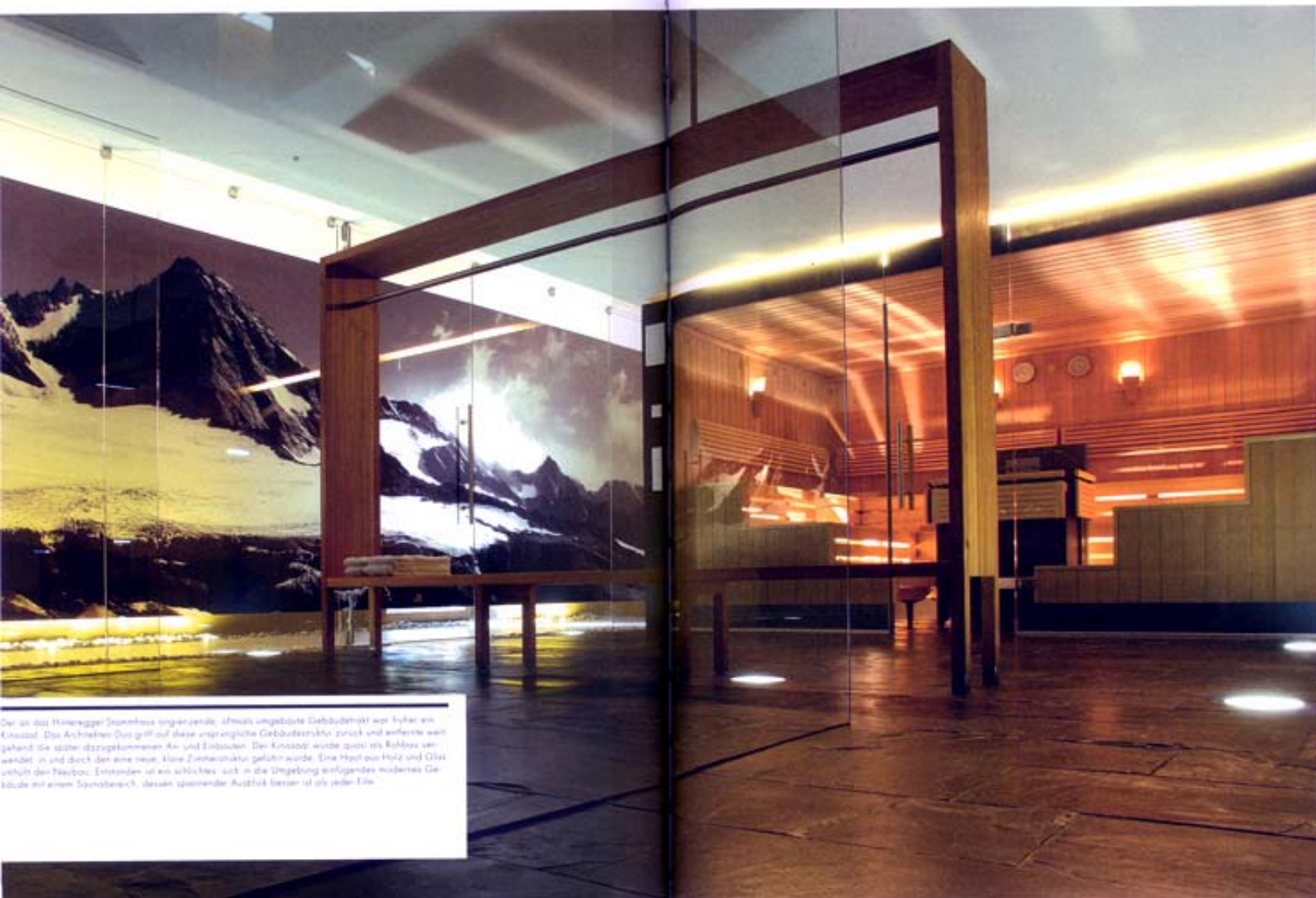
Der an das Hinteregger Kopenhaus angebaute, ehemals umgebauter Gebäudeteil war früher ein Kneisal. Das Architekturbüro ging auf diese ursprüngliche Gebäudestruktur zurück und erfindete weitgehend die später dazugekommenen Kiv- und Einbauten. Der Kneisal wurde quasi als Rohbau verändert, in und durch den eine neue, klare Zonenstruktur gelöhrt wurde. Eine Haut aus Holz und Glas umhüllt das Neubau. Entstanden ist ein architektonisch sich in die Umgebung einfügendes modernes Gebäude mit einem Saunabereich, dessen spannender Ausdruck besser ist als jeder Film.