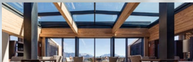
ELEGANT. GLASS. AUTOMATIC BUILDING OPENING.