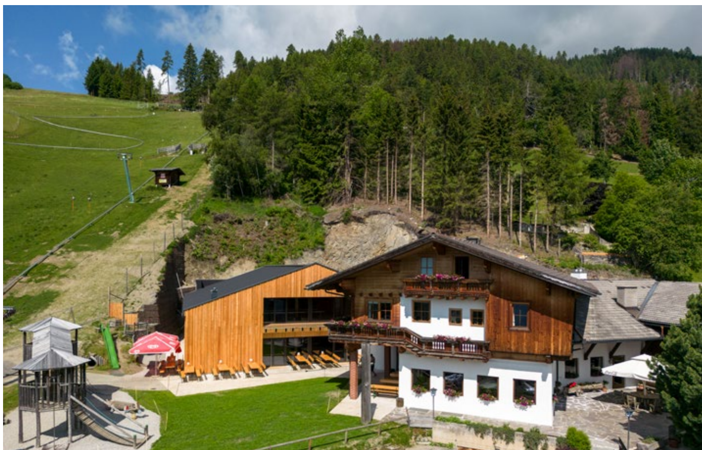
Blick auf den Gasthof Bärenwirt mit Bärenstadl und Freigelände. Im direkten Umfeld liegend der Wildpark und die Sommerrodelbahn Assling.