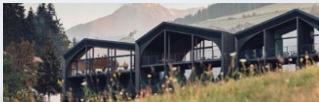
ELEGANT. GLASS. FACADE.