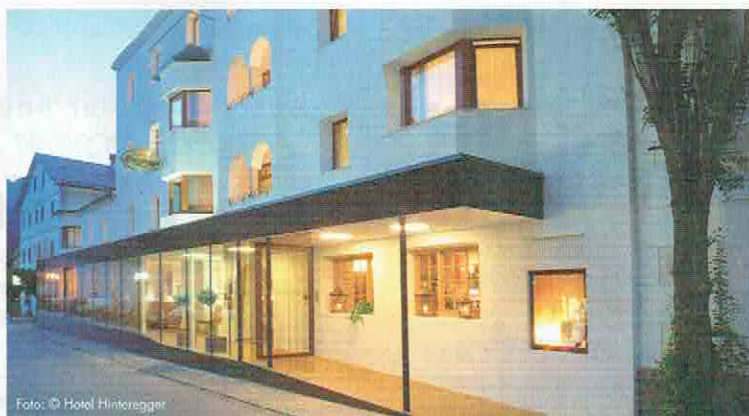
Seit dem Jahr 1903 befindet sich das Hotel-Gasthof Hinteregger im Ortszentrum von Matri i.O. in Familienbesitz.

jene des Jahres 1962 (erster Umbau des seit den 30er-Jahren bestehenden Kinosaaes in 13 Gästezimmer mit Fließwasser) bzw. jene der Jahre 1994 bis 1996 (Einbindung des benachbarten „Magnushauses“ in den Gasthaus-Hotel-Betrieb und Installation von 16 neuen Zimmern) besonders erwähnenswert sind.