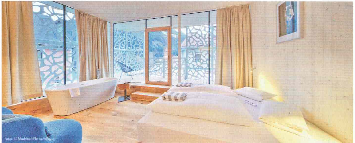
Großzügige Suiten, modern und doch gemütlich zugleich, laden im neuen wintergartigen Anbau zu Erholung und Entspannung ein.

Einheit zu formen. Das erste große Bauprojekt galt der Modernisierung des Nordost-Traktes. Dort, wo sich einst das alte „Ton-Kino“ befunden hatte, entstand ein neuer, moderner Gebäudeteil, bei dem Holz als prägender Baustoff zum Einsatz kam. 2007 konnte der Zubau mit bestens situierten Zimmern mit großzügigen Balkonen und mit einer mit viel Glas hell gestalteten Saunalandschaft eröffnet werden. Das Bestandstrepfenhaus wurde zu einem Foyer erweitert, das zwischen dem historisch-romantischen Altbau und dem modernen, klaren Gangbereich im Neubau