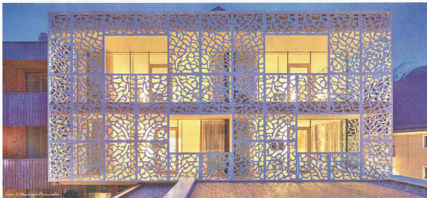
Blick auf den neuen Anbau an der Nordwestecke des Bestandsbaues, der durch die Verkleidung mit Laser geschnittenen Aluminiumblechen einen besonders reizvollen Blickpunkt darstellt.

Zentral und doch ruhig im Herzen der Marktgemeinde Matri i.O. gelegen, reicht die Geschichte des Iseltaler Gastbetriebes weit zurück. Aus der Zeit Maria Theresias stammt die Genehmigung für das Gast- und Schankgewerbe, wobei der jeweilige Besitzer gleichzeitig auch Konzessions-träger war. Alte Kaufverträge aus dem Jahre 1805 weisen darauf hin, dass hier eine „mayrische Wirtsbehausung“ mit Taverne bestand. 1903 wurde das Hotel-Gasthof Hinteregger von den Urgroßeltern der heutigen Inhaberin erworben. Seit dieser Zeit wird der „Hueter“, wie er in Matri genannt wird, als Familienbetrieb geführt, und immer waren die „Hueter“-Frauen begeisterte Gastgeberinnen. Aus dem ursprünglichen Gasthaus entwickelte sich im Laufe der Zeit ein florierender Hotelbetrieb. Die Basis dafür stellten wiederholte Um- und Ausbauten dar, wobei