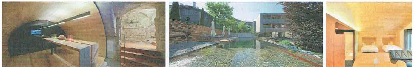
Gemeinsam mit dem Architekturbüro Madritsch & Pfurtscheller hat die jüngste Inhabergeneration den Traditionsbetrieb durch sorgsam durchdachte Um- und Ausbauschritte an die Erfordernisse der heutigen Zeit angepasst.

Ab Oktober 2009 widmete man sich der Neuprüfung weiterer Zimmer und eines Massageraumes im Bestandskomplex. Das Ergebnis des nächst größeren Bauabschnittes mit Fertigstellung im Jahre 2011 war ein neuer Eingangsbereich mit angrenzendem Speisesaal. Die Fassade des Hotelgebäudes wurde erneuert und energietechnisch modernisiert bzw. konnten neue, barrierefreie Installatio-